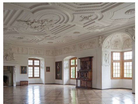
Saal im Schloss Spiez