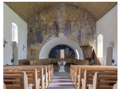
Auch die Kirche Diemtigen ist teil der Kirchenwege

Besuche die eindrücklichen Kirchen im Diemtigtal und Simmental und tauche ein in spannende Geschichten. > kirchenwege.ch