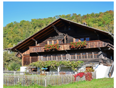
Heimat- und Rebbaumuseum