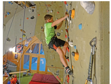
Abwechslungsreiche Kletterwand in der Sporthalle Wiriehorn

Tarife/Tag: Erwachsene Fr. 8 | Kinder –16 J. & Lernende Fr. 5 | Auskünfte für Gruppen, Schulen & Materialausleihe via Abwartinnen