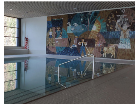
Bödelibad Interlaken in Unterseen

T 033 827 90 90, > boedelibad-interlaken.ch