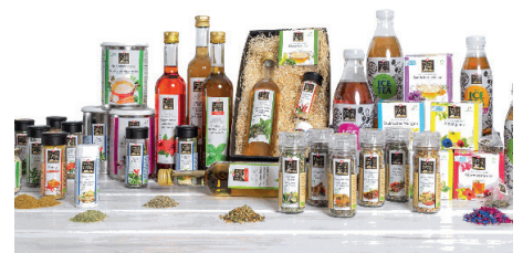
Ein Teil des Swiss Alpine Herbs Sortiments