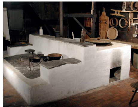
Die Küche des Agensteinhauses