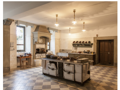
Schlossküche im Schloss Hünegg