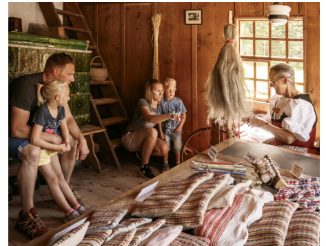
Traditionelles Handwerk im Freilichtmuseum Ballenberg

Offen: Jeden ersten Sa im Monat, 13–17 h oder auf Voranmeldung T 033 773 60 73