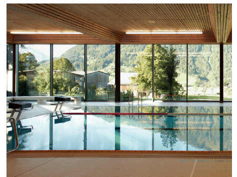
Schwimmen & Wellness in Aeschi