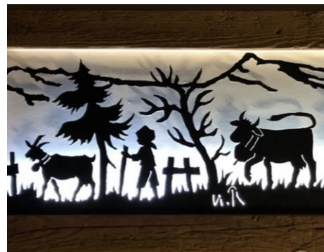
Kunstwerk im Atelier Mini-Art