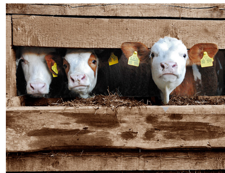
Gwundrige Kälber auf dem Bauernhof