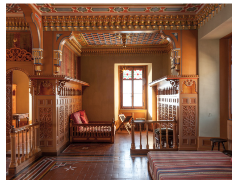
Das Schloss Oberhofen von Innen