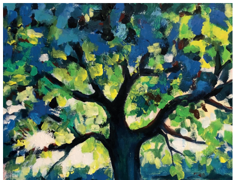
Gemälde von Silvia von Allmen

T 033 681 19 44 oder 079 385 96 19, s.vonallmen@bluewin.ch