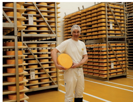
Voller Reifekeller in der Naturparkkäserei

T 033 681 10 00, > simmental-switzerland.com