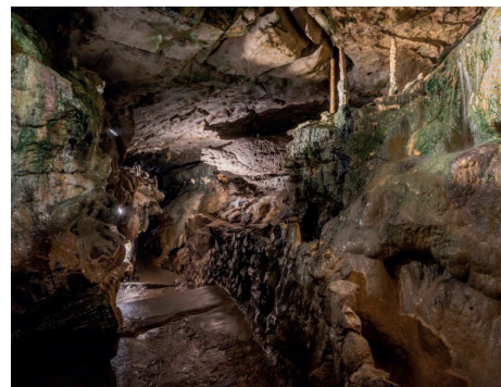
Imposante Grotten der St. Beatus-Höhlen