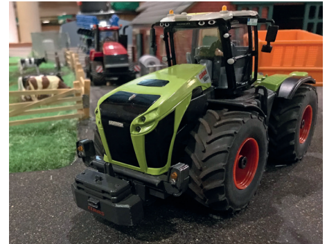
Spielspass im Modellspielland Diemtigtal

Ein Abenteuer für Gross und Klein: Ob du ein Kind bist, das fasziniert die ferngesteuerten Fahrzeuge steuern möchte, oder ein Erwachsener, der sich auf der längsten Carrerabahn weit und breit duellieren möchte, bei uns kommt jeder auf seine Kosten. Die interaktiven Möglichkeiten machen das Modellspielland zu einem Ort, an dem Generationen zusammenkommen, um gemeinsam Spass zu haben. Also schnapp dir deine Familie, Freunde oder Kollegen und erlebe gemeinsam die Welt der Miniaturwunder im Massstab 1:32 im Modellspielland Diemtigtal. Öffnungszeiten & Infos: > modellspiellanddiemtigtal.ch