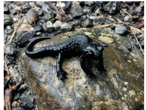
Der kleine Alpensalamander geniesst das Regenwetter