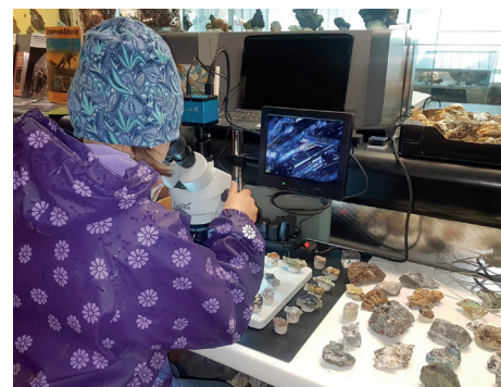
Spannende Entdeckungen im BEO Mineralienmuseum in Wimmis