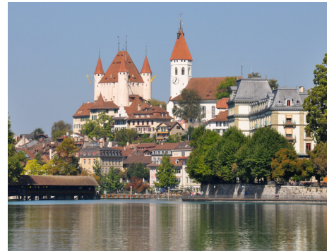
Schloss Thun: das Wahrzeichen der Stadt Thun

Offen: Mitte Mai–Mitte Oktober, siehe Öffnungszeiten Schlösser Reservation & Fragen: info@thunerseeschloesser.ch oder T Oberhofen: 033 243 12 35; T Thun: 033 223 20 01; T Spiez: 033 654 15 06