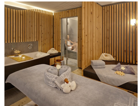
Beatus Wellness & Spa Merligen

Bowling, Indoor Golf, Billard & Dart, Live Sport. Gerne verwöhnen wir euch auch kulinarisch. Reservationen nehmen wir telefonisch entgegen. T 033 650 98 38, > timeout-bowling.ch